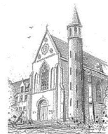
Parochie O.L.V. Onbevlekt Ontvangen Zenderen

Op 8 oktober 2020 is een parochievergadering gehouden: Enkele informatie punten: